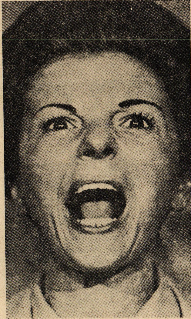
Peronizmin iflasi, İzabel Peron'un devrilişiyile noktalandı.

Arjantin Güney Amerika kıtasında tarıma elverişli arazisi geniş olan bir ülkedir. Buğday, pamuk, bağcılık ve hayvancılık gelişmiştir. Tarım sanayiden daha ileridir. Ülkede maden çıkarımı çok önemsizdir. Ancak petrol üretimi kendi iç-