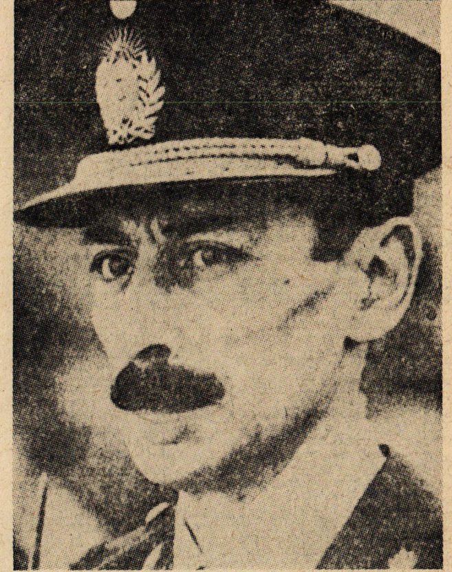
Jorc Videla : Yaptığı askeri darbeyi notere tasdik ettirdikten sonra Cumhurbaşkanı oldu.

el ele vererek zenginliklerini gündüne artırdılar.