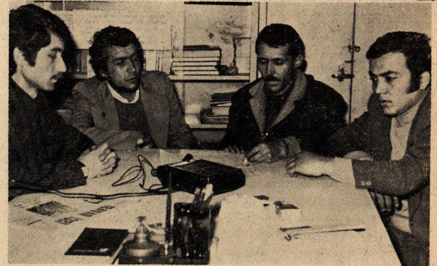
Maden işçileri son gelişmeleri tartışıyor.